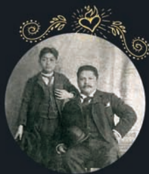
Jose Guadalupe Posada